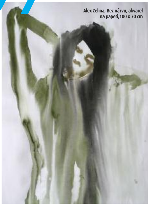
Alex Zelina, Bez názvu , akvarel na papieri, 100 x 70 cm