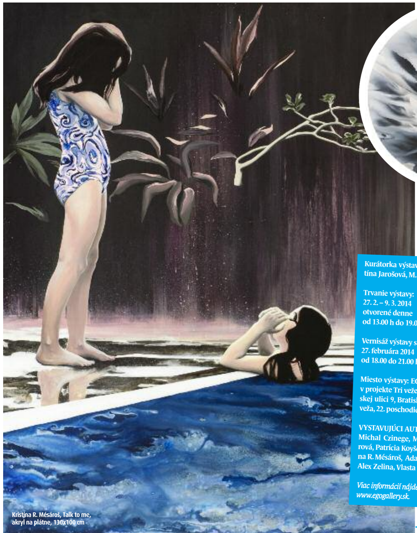
Kristína R. Mésároš, Talk to me , akryl na plátne, 130x100 cm